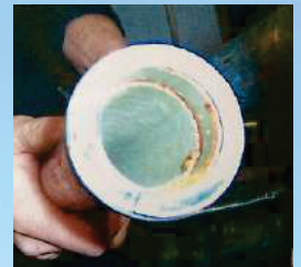
12 Monate später (Mercedes-Benz Werk)