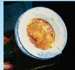
vorher (Mercedes-Benz Werk)

Durch die Wirkungsweise des PAULYSAN® -Gerätes werden auch Rohr-Korrosionen angehalten, Rost und Kalk abgetragen und eine Korrosionsschutzschicht aufgebaut. Diese Schutzschicht besteht aus Metallkarbonat, diese ist sehr hart und verhindert die Bildung neuer Korrosionen. Abbildungen Rechts: Vor und 12 Monaten nach der Inbetriebnahme des PAULYSAN® -Gerätes.